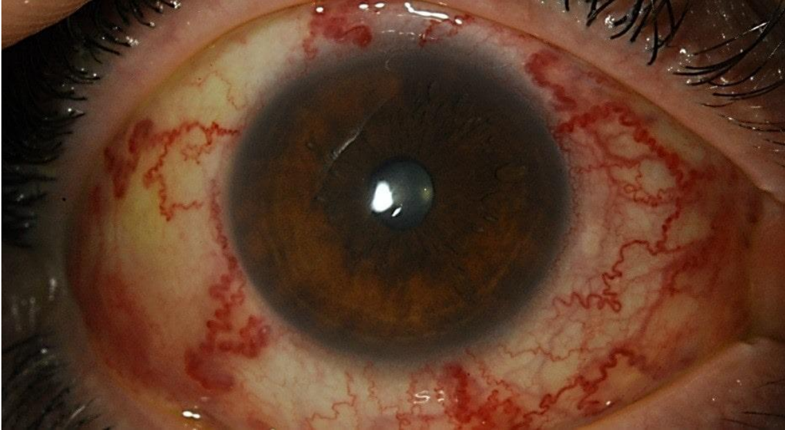
Imagen 1. Fístula carótido-cavernosa