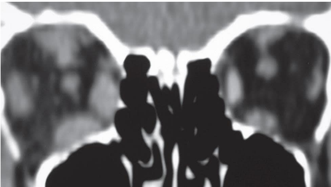
Imagen 4. Pruebas de imagen fístula carótido-cavernosa. Engrosamiento congestivo de músculos extraoculares.