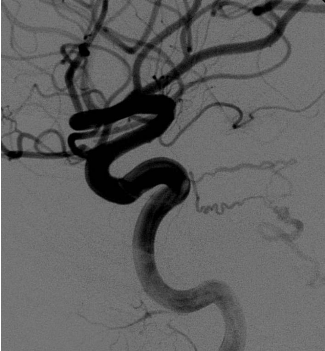
Imagen 5. Imagen angiográfica fístula carótido-cavernosa de bajo grado.