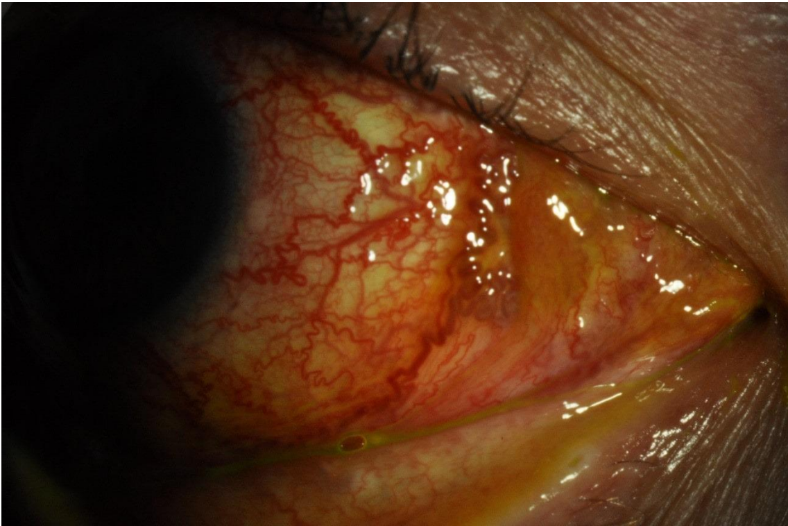
Imagen 2. Fístula carótido cavernosa. Detalle.