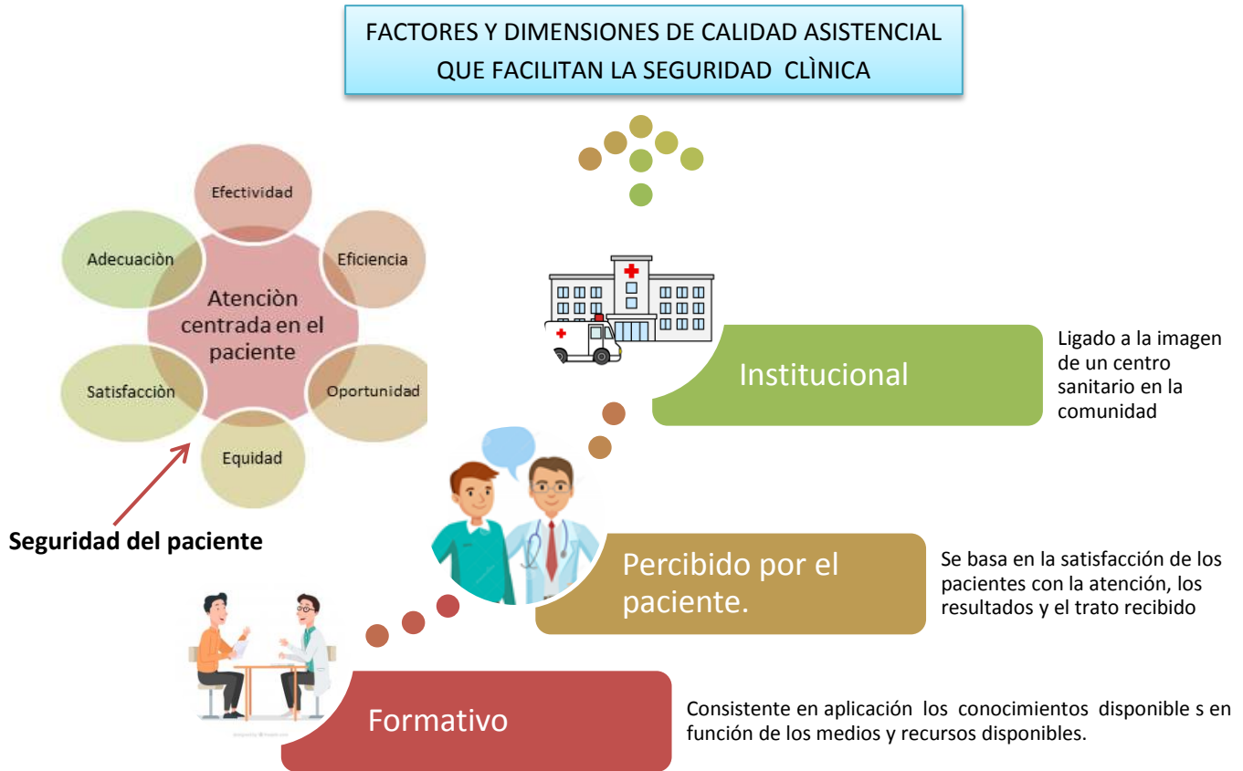
Gráfico N°2 Factores de calidad asistencial

Fuente: Adaptado de (MSSSI, 2016) (Roccoa & Garrido, 2017)