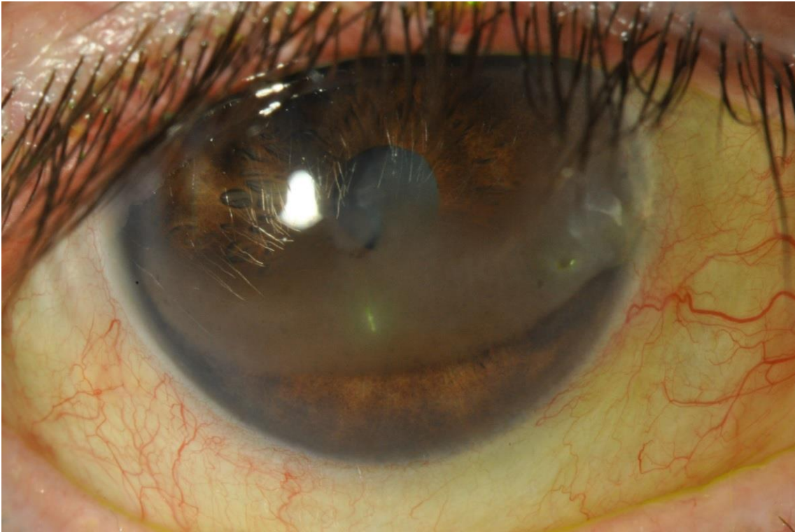
Imagen 1. Queratopatía en banda