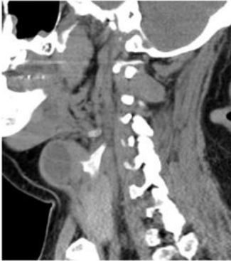
Fig. 1. TC cervical con contraste (Corte sagital) Quiste branquial de la tercera hendidura. Imagen quística multiloculada con bordes lisos con contenido hipodenso con fijación a membrana cricotiroides izquierda.