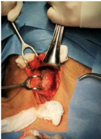
Fig. 5. Lecho quirúrgico (Vista inferior). Se evidencia la escisión completa del quiste.