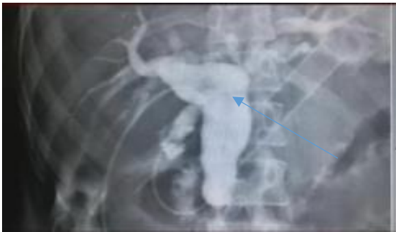
Figura 3. Colangiografía transoperatoria presencia de litos.