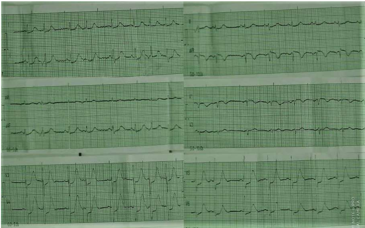
Figura 1. Electrocardiograma de doce derivaciones donde se observa infradesnivel del punto J en derivaciones precordiales (V3-V6) con ondas T hiperagudas, que corresponden con el patrón de «de Winter».