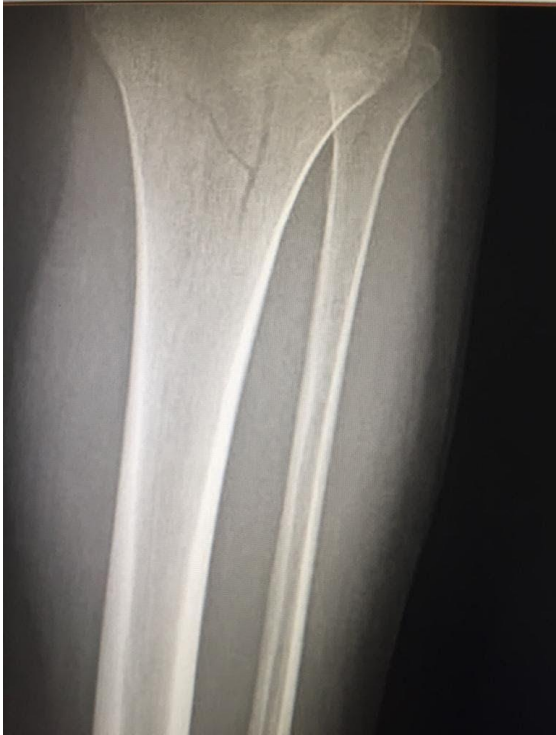
IMAGEN N° 2: Fractura