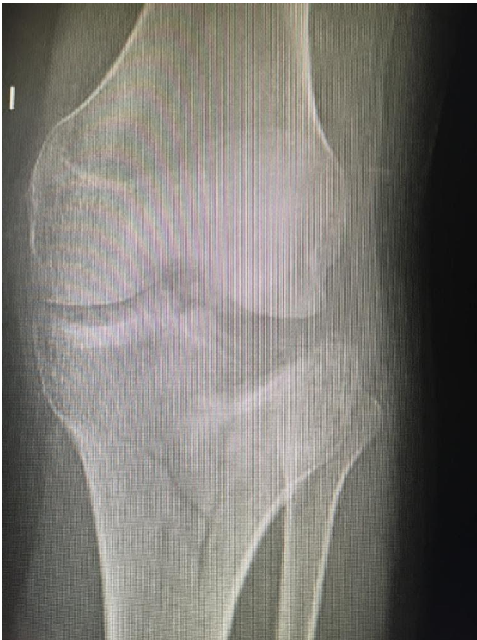
IMAGEN N°4: Fractura intervenida quirúrgicamente