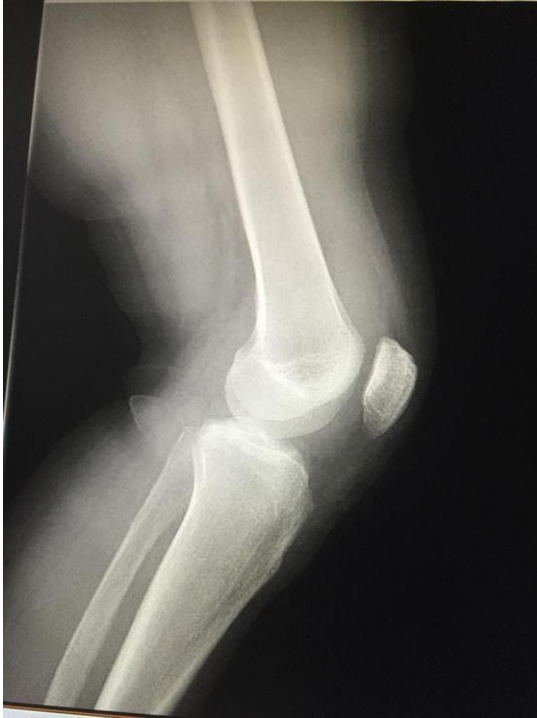
IMAGEN N° 3: Fractura