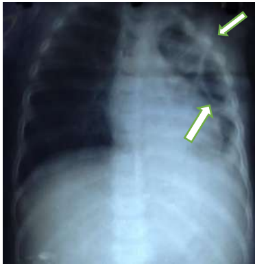
Figura 2. Presencia de imágenes de paredes finas, hipodensas, redondeadas, de bordes regulares.