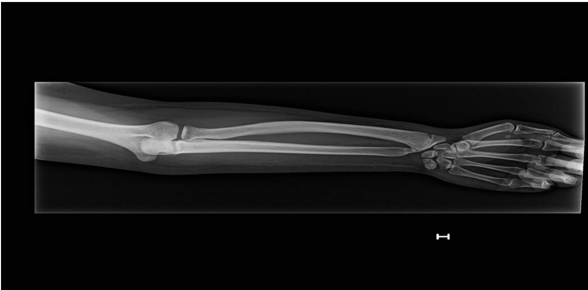
Figura 2: Imagen radiológica de la deformidad de Madelung