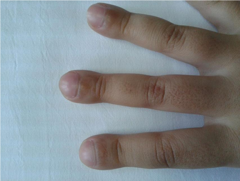
Figura 1: acropaquias