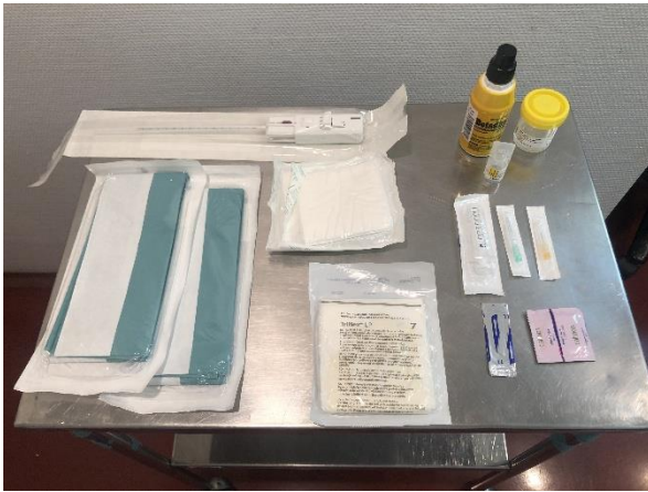
Imagen nº 1: Material de la biopsia.