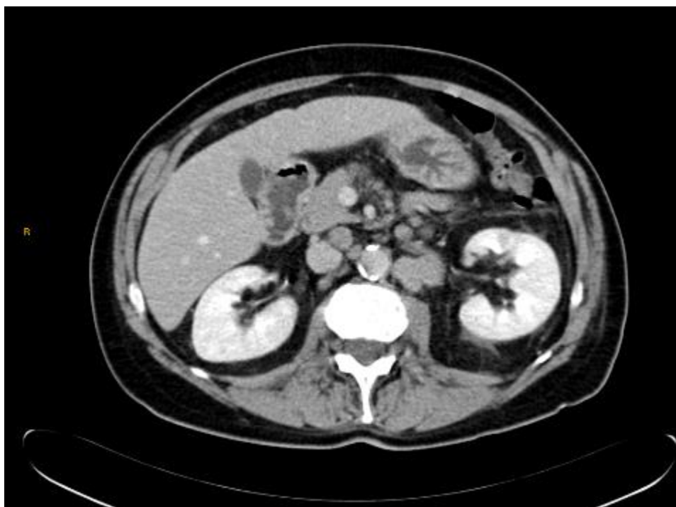
Adenopatía retroperitoneal única