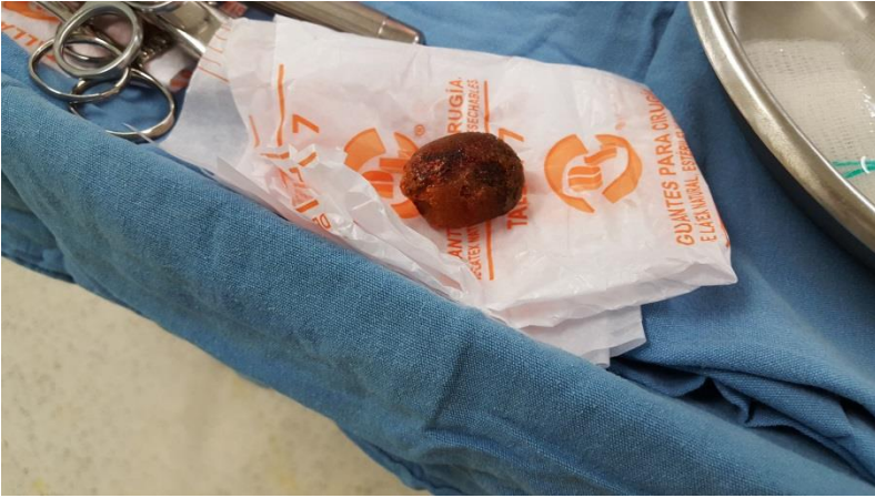
Imagen 4: lito extraído.