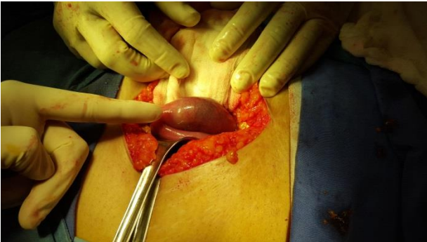
Imagen 2: tumoración intraluminal en íleon